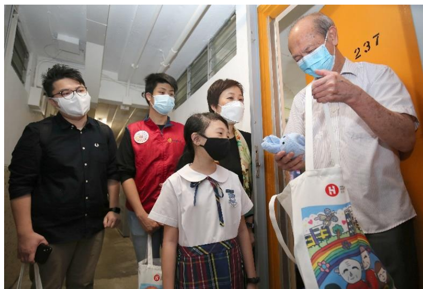
得獎者及房協獎學金同學會義工一同探訪乙明邨長者住戶，並送上由得獎作品印製成的禮物包以表心意。