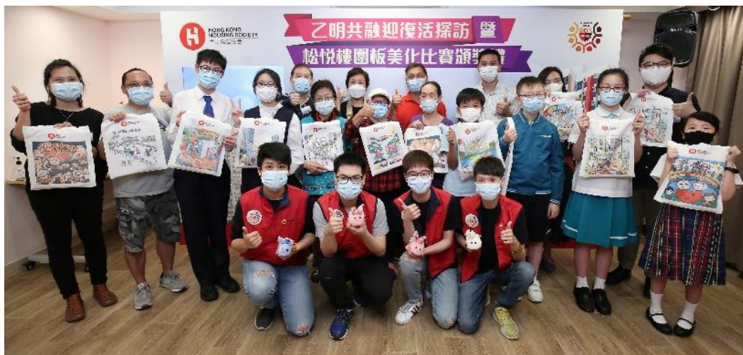
「乙明邨松悅樓圍板美化比賽」得獎者於頒獎禮上喜獲嘉許。